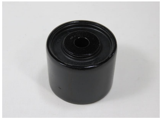
OPTION パーツ リヤメンバー側デフマウント単体