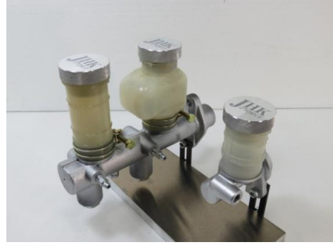
Cap set のみ