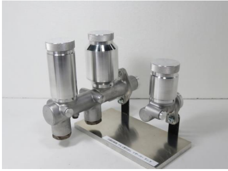
TypeA1,A2,A3 (Full set)