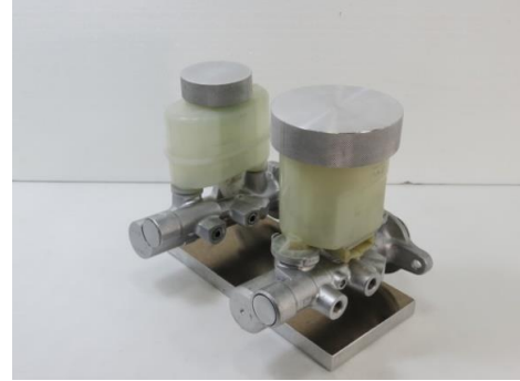
R32,33,34,S13,S14とR34,S15,Z32等 予定 トヨタ86、BRZ 販売予定