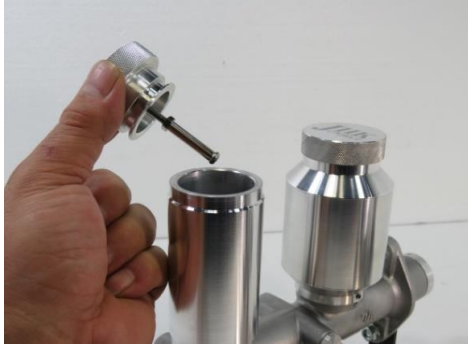
レベルゲージ (TypeA1,A2,A3のみ)